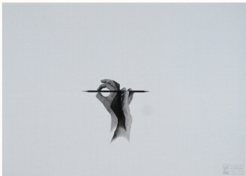
木村秀樹《Pencil 2-20》 1974年、スクリーンプリント